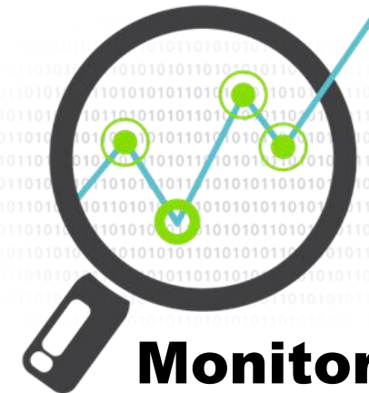
Monitoring & Reporting