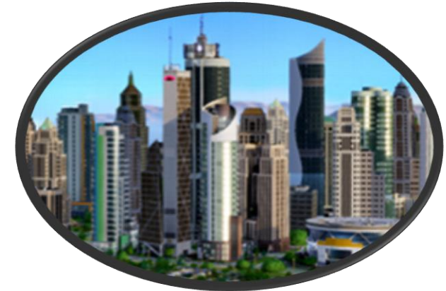
Mega/Smart (Slum) City